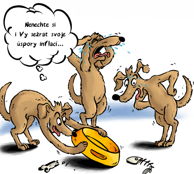
ČÁSTKA NA BĚŽNÉM ÚČTĚ, ČI DOMA 100.000,-

V prvním čtvrtletí roku 2022 se očekává meziroční inflace k 8%, možná až k 10%. Potom ekonomové předpokládají, že by inflace mohla klesat. Pro ochranu financí proti inflaci dnes existuje řada nástrojů. Ať jsou to různé typy dluhopisů, nemovitostní fondy či komodity. Rádi vám v tom poradíme.